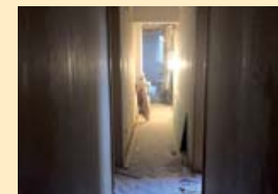
Neue Stromverteilung: Noch sieht es sehr nach Baustelle aus ...