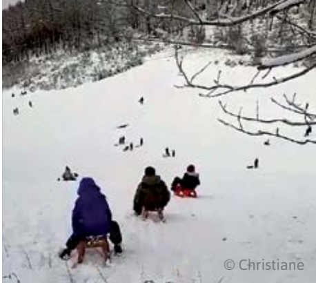
Rodeln ist klasse; das finden auch die Mamas!