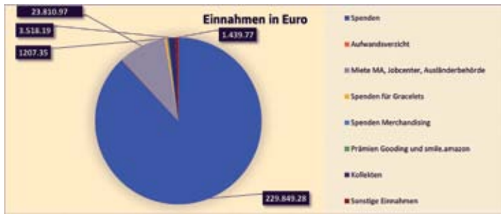
Einnahmen Verein 2020