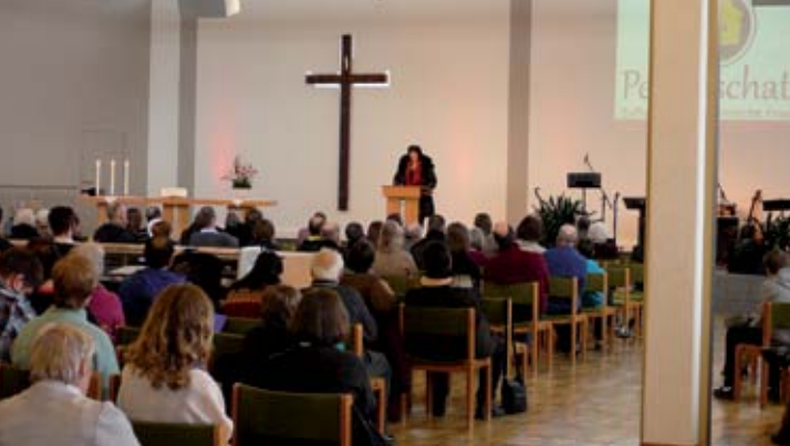
Perlenschatz bei der EFG Gießen am 17.01.2016