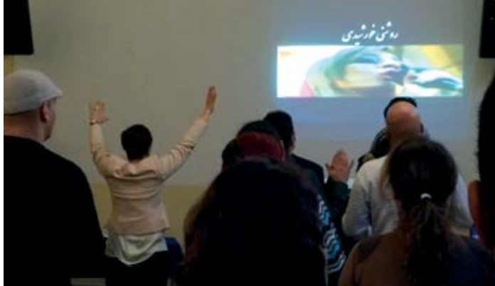
Gottesdienst der Persischen christlichen Gemeinde Frankfurt am 07.02.2016