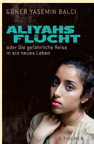
Liebesgeschichte einer Kurdin

Perlenschatz e. V. · Postfach 11 13 · 35599 Solms · Deutschland Telefon: 06442 9543994 · Telefax: 06442 9537692 · E-Mail: info@perlenschatz.info